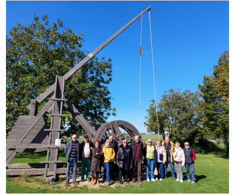
Découverte du patrimoine voisin 05/10/2024