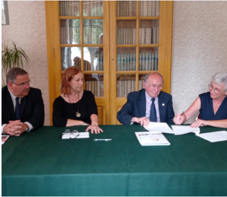
Partenariat Fondation du patrimoine 04/09/2024.