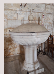
Baptistère et grille