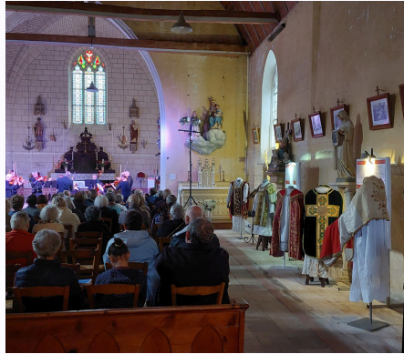
Journées européennes du patrimoine 21-22/09/2024.