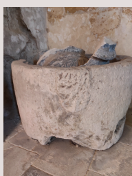
Baptistère et morceaux du bénitier.