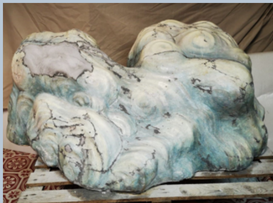
Après anoxie et en cours de restauration