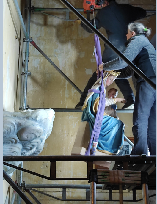
Installation de la Vierge à l'Enfant