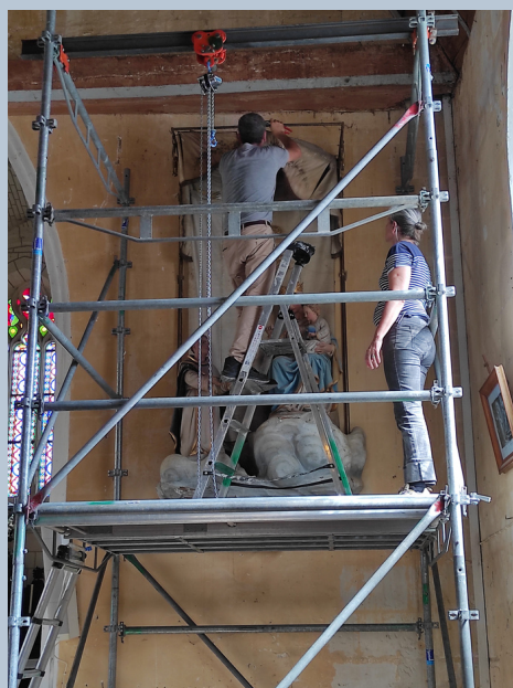
Décrochage du dais