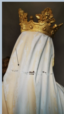
Trait de jonction