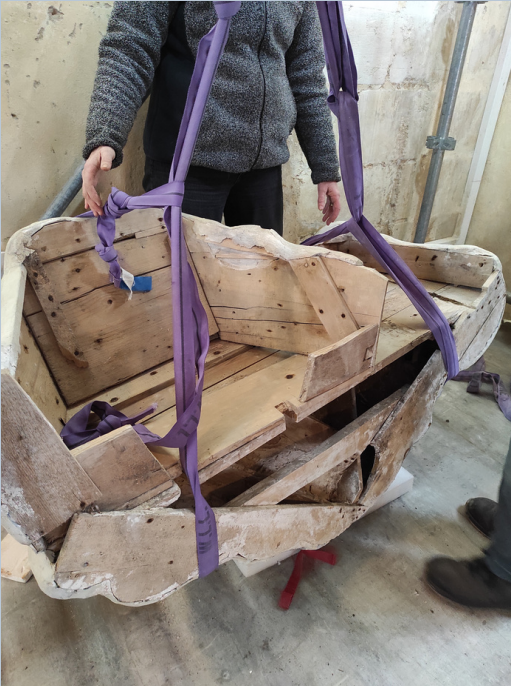
Remise en place du nuage