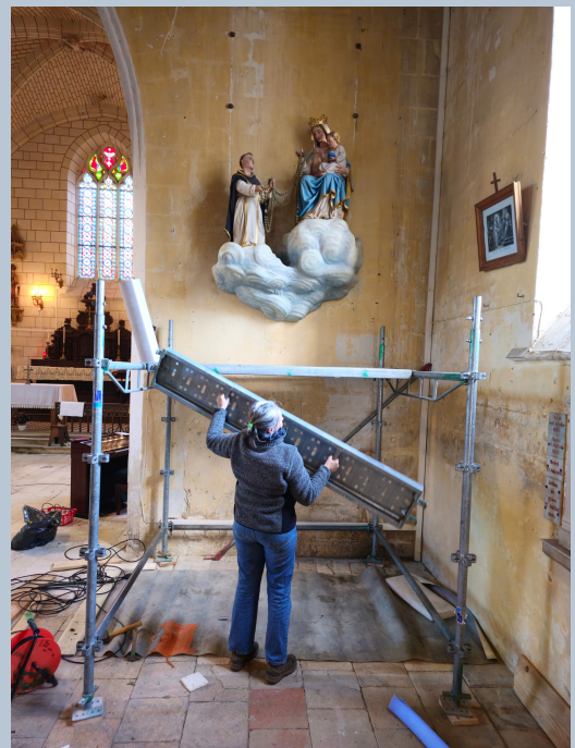
Démontage de l'échafaudage