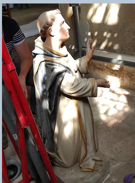
Dépose de saint Dominique