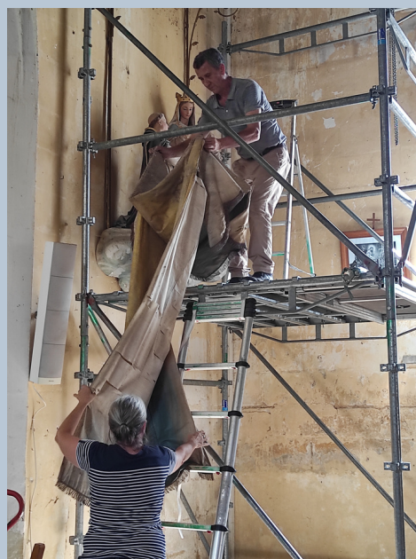
Descente du dais