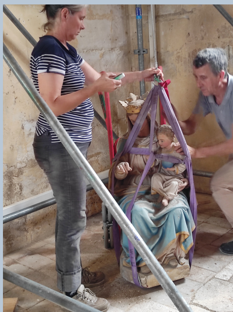
Dépose de la Vierge à l'enfant