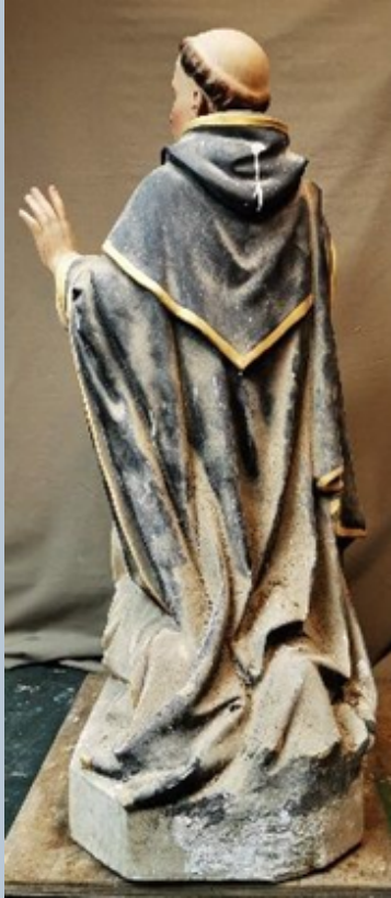
Statue avant restauration