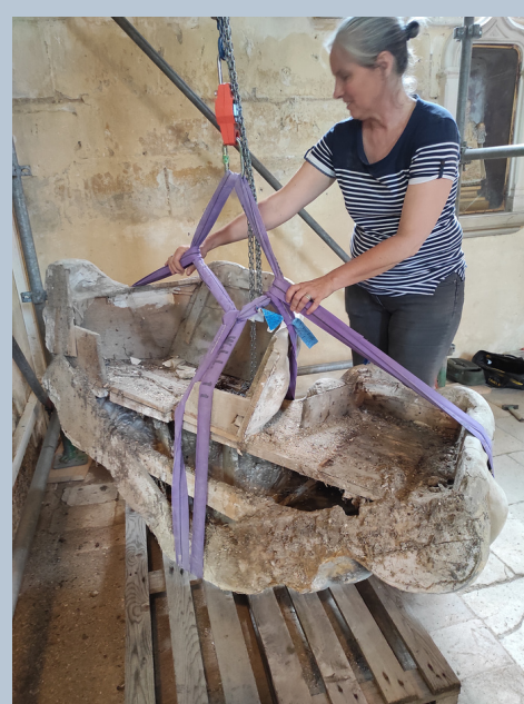
Dépose du nuage