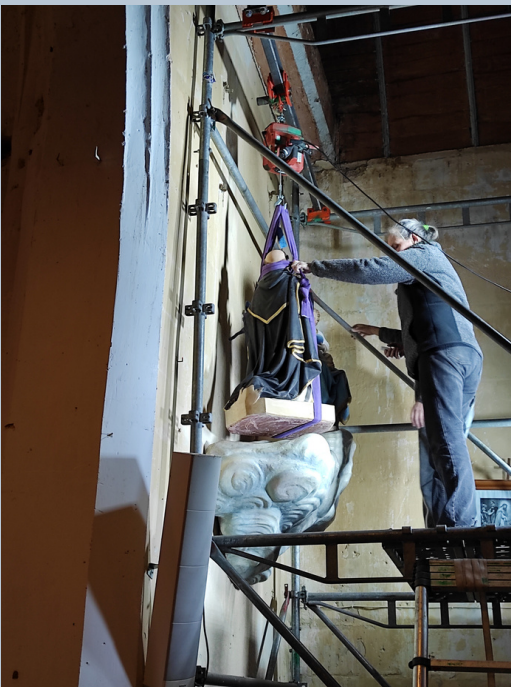
Installation de saint Dominique